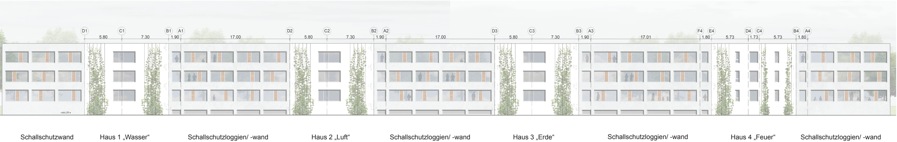
Ansicht Nord-West, Bahnseite M 1|350