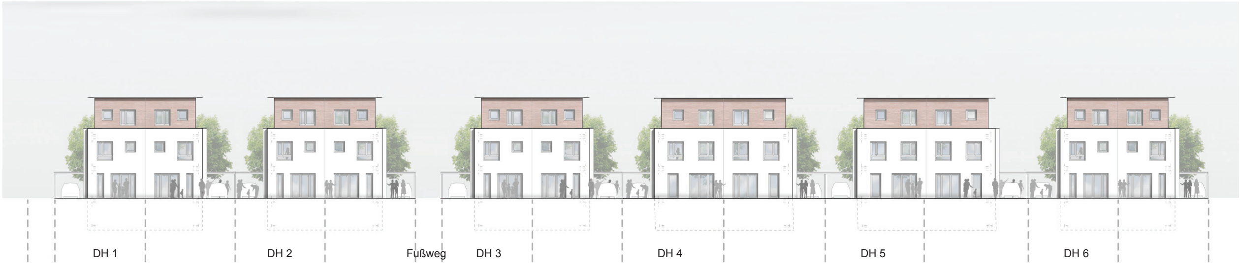
Ansicht Süd-West, Doppelhäuser (Gartenseite) M 1|350