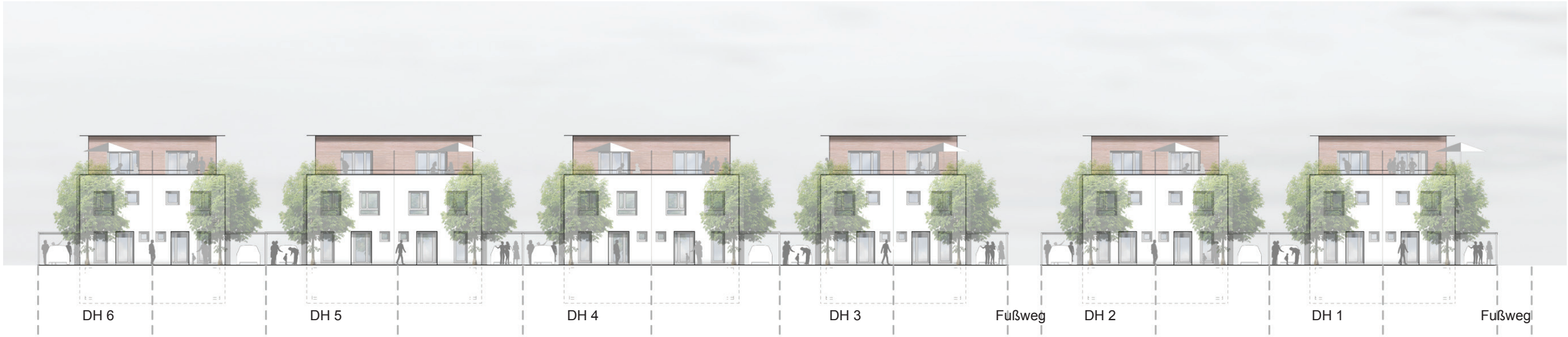
Ansicht Nord-Ost, Doppelhäuser (Maxauer Straße) M 1|350